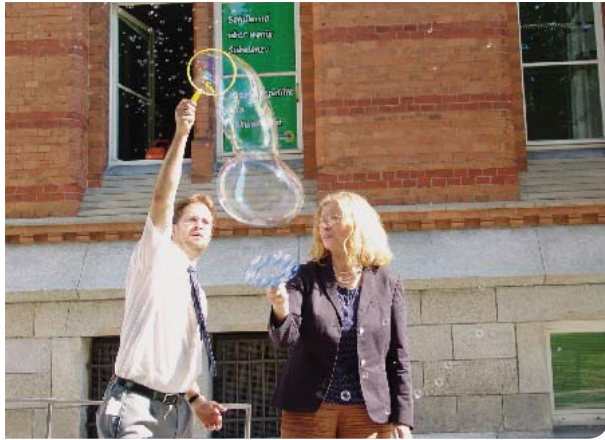
Protest gegen die „Haushaltsseifenblasen“ der Landesregierung

Liebe Freundinnen und Freunde, nach fünf Jahren Regierungsarbeit und einem Jahr Opposition im schleswig-holsteinischen Landtag, mit einem schönen Ergebnis von 12,2 Prozent bei der Direktwahl im Kreis Schleswig-Flensburg, verlasse ich zum 30. Mai 2006 Schleswig-Holstein. Zukünftig werde ich, gemeinsam mit meinem Ehemann, wieder Rechtsanwältin in Köln sein.