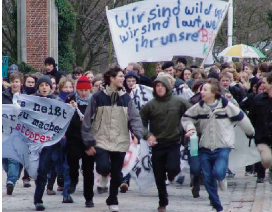
Protest gegen die Landesregierung treibt immer mehr Menschen auf die Straße