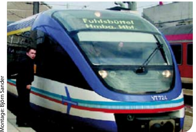
Montage: Björn Sander