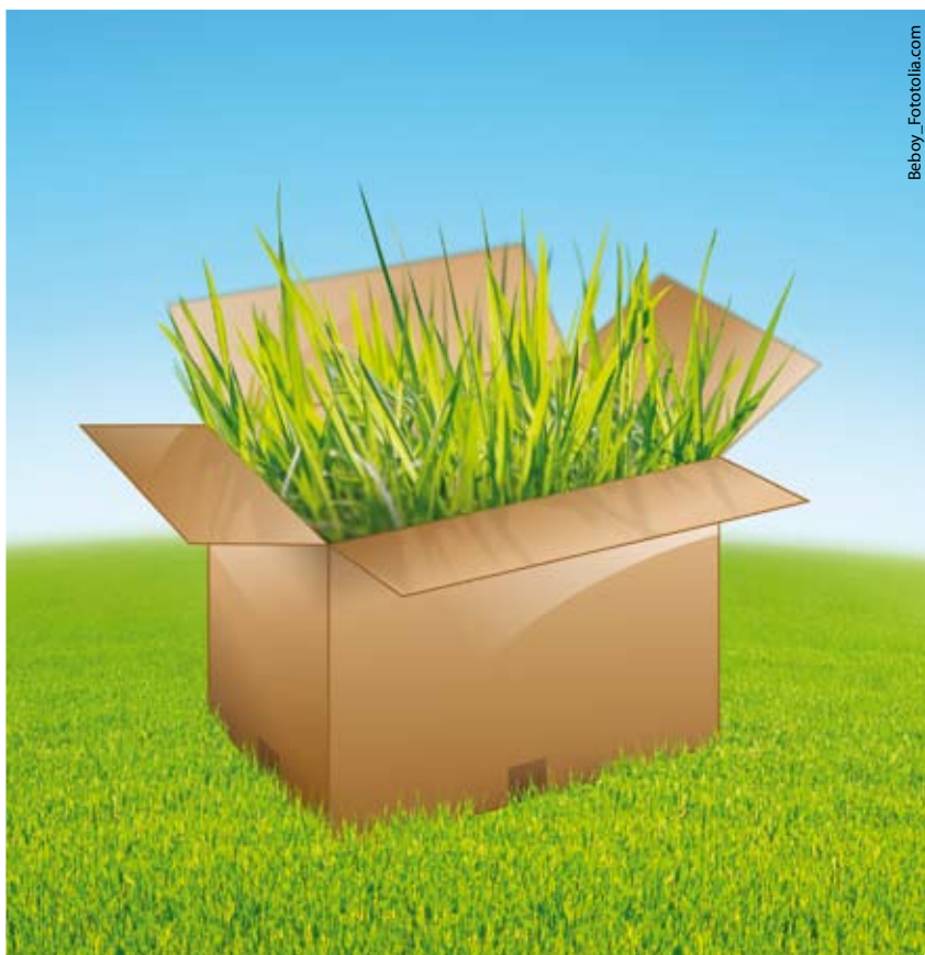
Das Grüne Haushaltspaket für mehr Klimaschutz und Bildung

Personal- und Sachkosten in der Verwaltung und beim „Schleswig-Holstein-Fonds“ sparen. Und wir fordern, dass