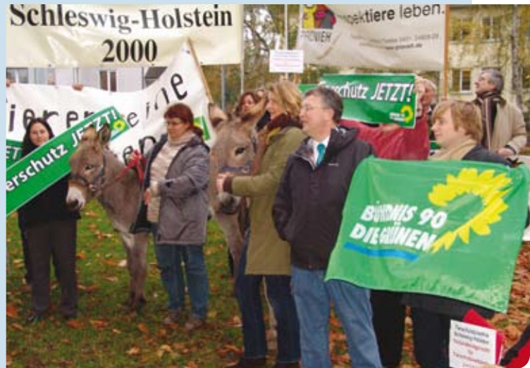
CDU und SPD sind störrischer als die Esel Patty und Pepper: Sie haben unseren Gesetzesentwurf schon sechsmal vertagt.

Um den öffentlichen Druck zu erhöhen, haben wir gemeinsam mit Tierschutzverbänden vor dem Landeshaus demonstriert.